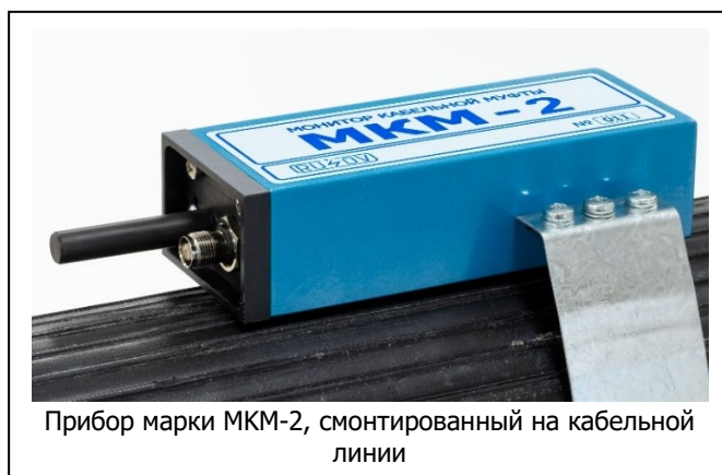
Прибор марки МКМ-2, смонтированный на кабельной линии

Диагностическое устройство марки МКМ-2 является современным интеллектуальным беспроводным прибором, предназначенным для стационарного контроля технического состояния высоковольтных кабельных линий.