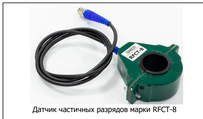
Датчик частичных разрядов марки RFCT-8